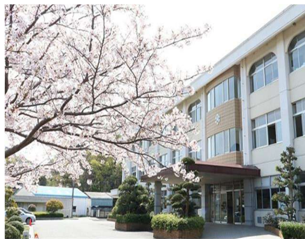
伯方キャンパス校舎