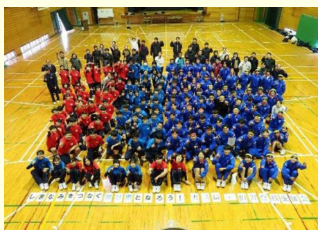
合同グループマッチ