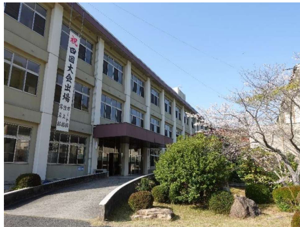
大三島キャンパス校舎